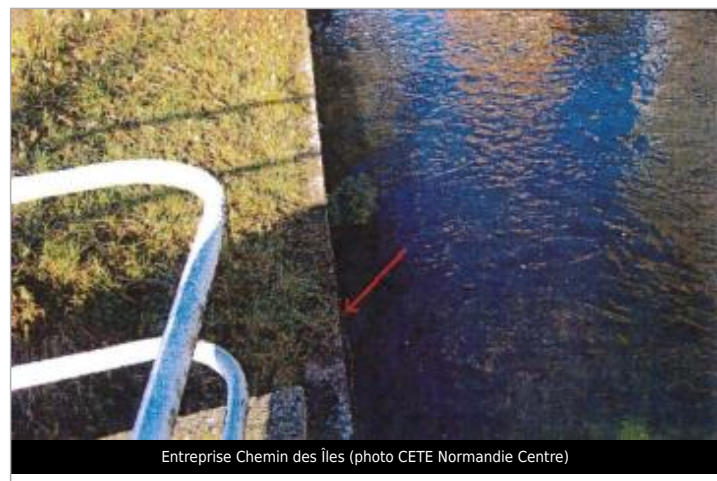
Entreprise Chemin des Îles

GÉNÉRAL Code : EureMoy17_R_0028_a Date de mise à jour : 08/02/2019 Auteur :