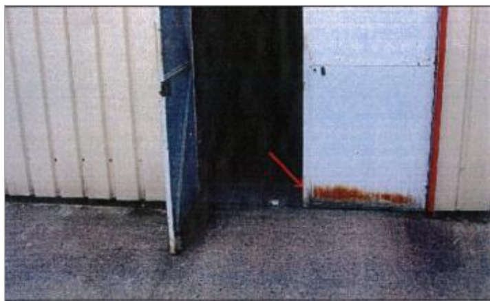
5 Rue des Peupliers