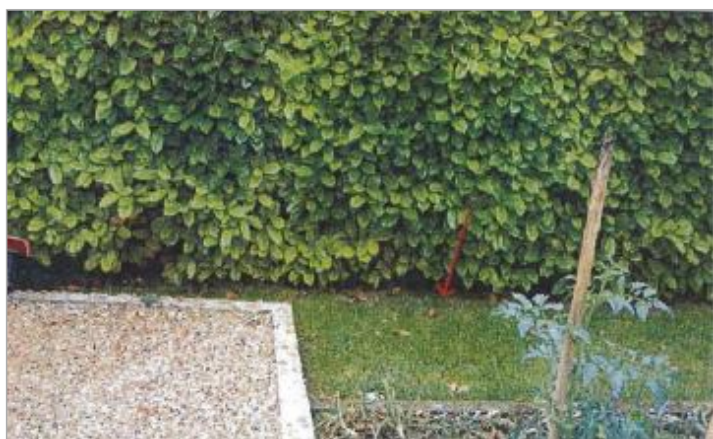
21 Résidence des Sablons

Code : EureMoy17_R_0022_a Date de mise à jour : 08/02/2019 Auteur :