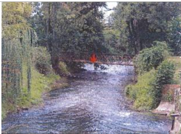
Rue du Moulin