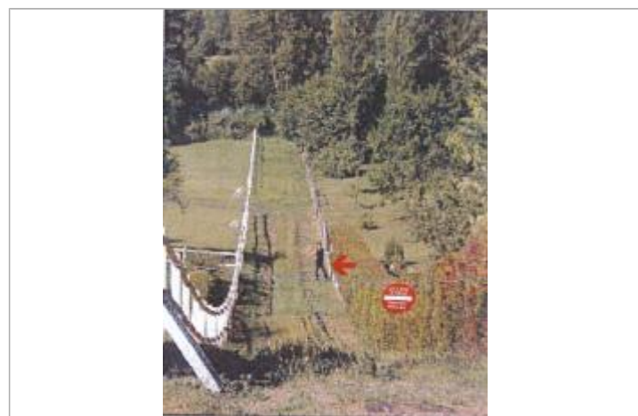
Maisons entre Chambine et Hécourt