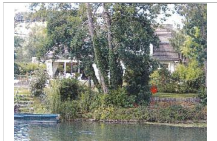
Lotissement Avenue de l'Eure

GÉNÉRAL Code : EureMoy17_R_0016_a Date de mise à jour : 13/02/2019 Auteur :