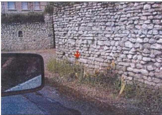
36 Rue Alfred de Vigny