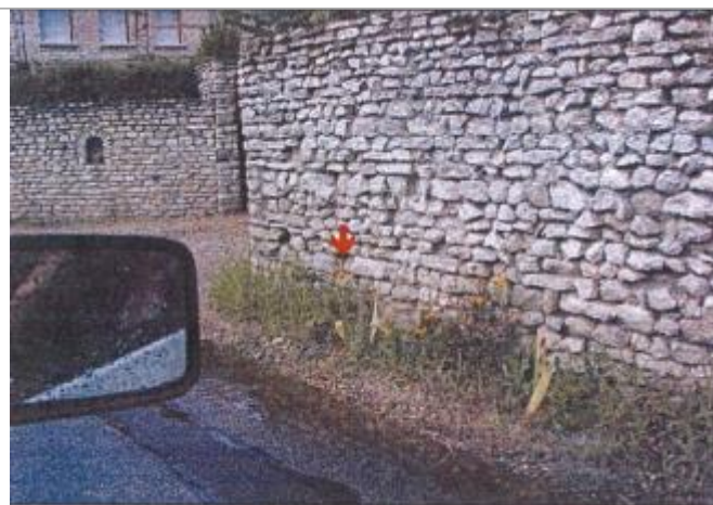
36 Rue Alfred de Vigny