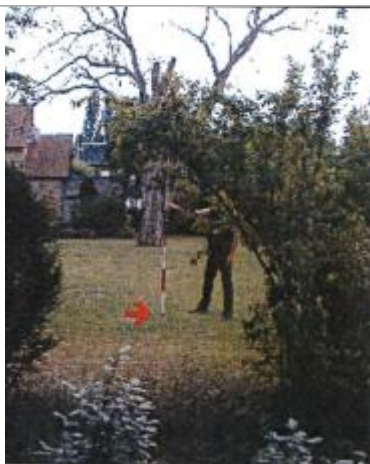
7 Chemin de la Chapelle