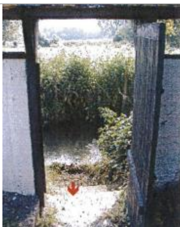
Rue Denis Tardif