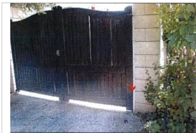
16 Impasse du Lavoir

Code : EureMoy17_R_0007_a Date de mise à jour : 08/02/2019 Auteur :