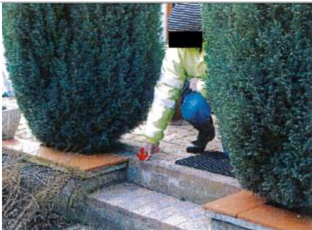
39 Rue de Bu