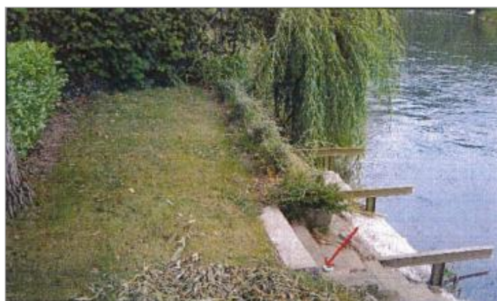
3 Rue de Louvedalle

Code : EureMoy17_R_0034_a Date de mise à jour : 23/08/2022 Auteur :