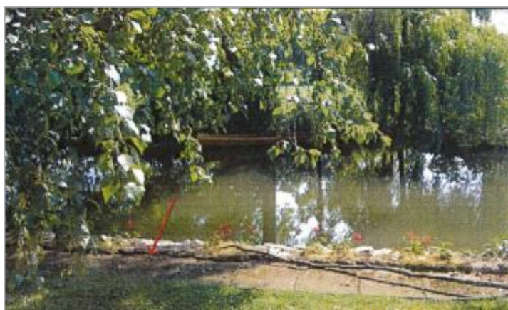
Chemin du Mouché

Code : EureMoy17_R_0033_a Date de mise à jour : 23/08/2022 Auteur :