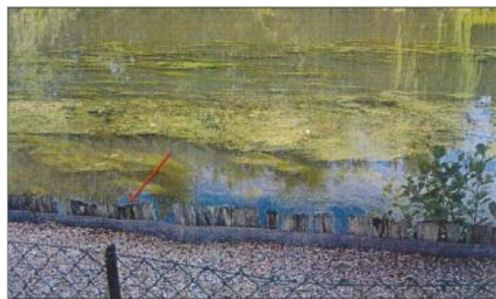
6 Sente de l'Abreuvoir

GÉNÉRAL Code : EureMoy17_R_0032_a Date de mise à jour : 23/08/2022 Auteur :