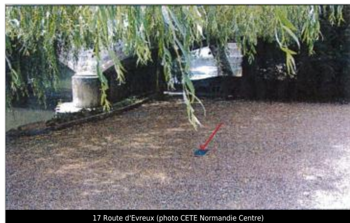
17 Route d'Evreux

GÉNÉRAL Code : EureMoy17_R_0029_a Date de mise à jour : 08/02/2019 Auteur :