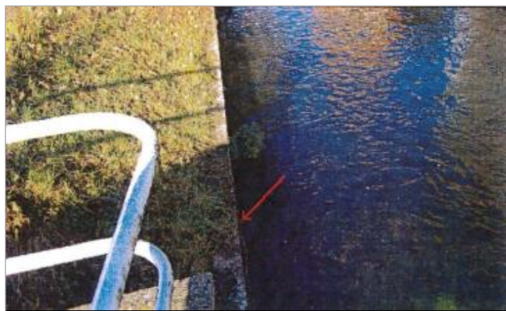
Entreprise Chemin des Îles

GÉNÉRAL Code : EureMoy17_R_0028_a Date de mise à jour : 08/02/2019 Auteur :