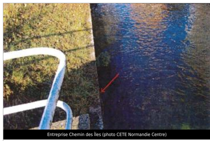
Entreprise Chemin des Îles

GÉNÉRAL Code : EureMoy17_R_0028_a Date de mise à jour : 08/02/2019 Auteur :