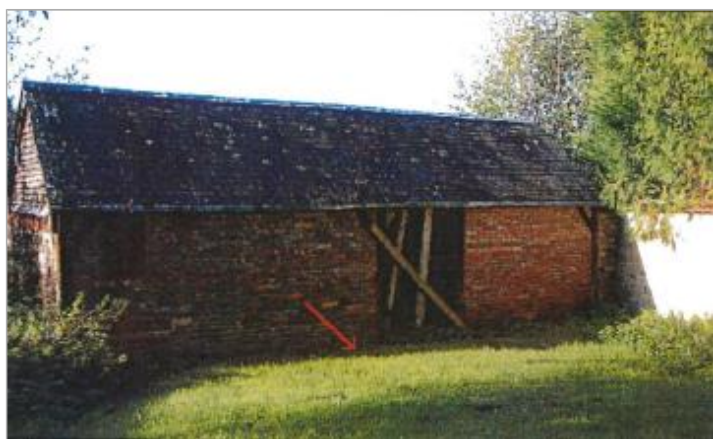
Lavoir rue des Marais

Code : EureMoy17_R_0026_a Date de mise à jour : 08/02/2019 Auteur :