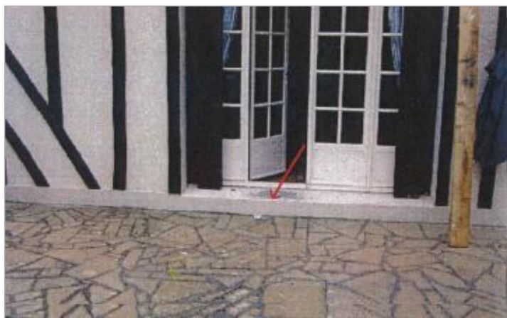
7 Chemin du Gué Turbure