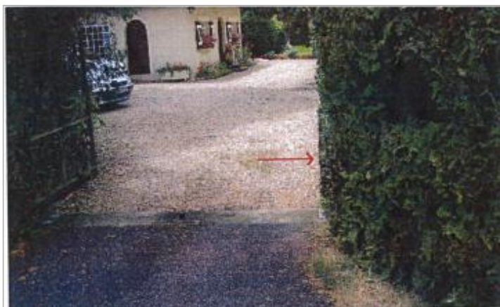
79 Chemin des Gdes Vignes