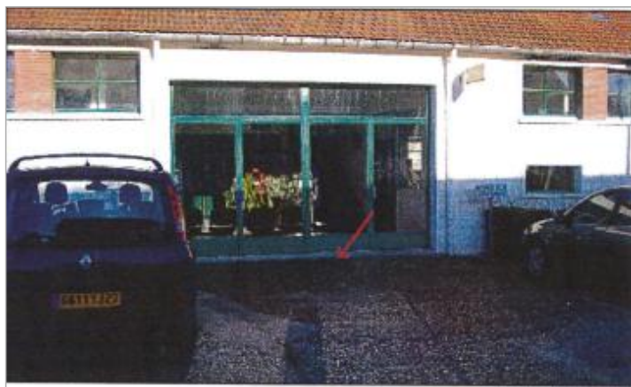
19 Rue aux Honfroys