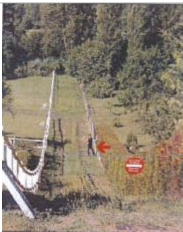
Maisons entre Chambine et Hécourt