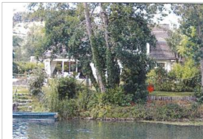
Lotissement Avenue de l'Eure