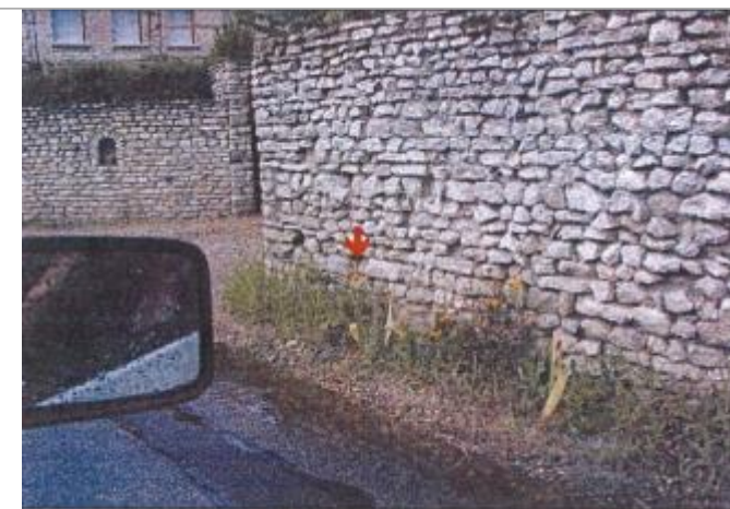
36 Rue Alfred de Vigny