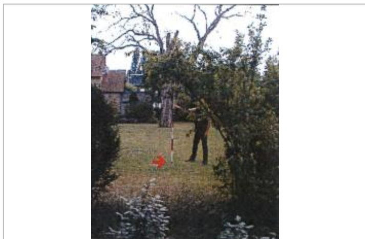
7 Chemin de la Chapelle

Code : EureMoy17_R_0014_a Date de mise à jour : 08/02/2019 Auteur :