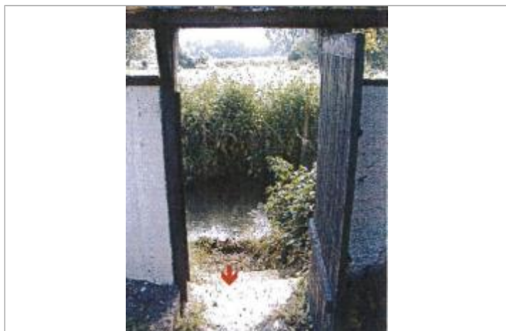
Rue Denis Tardif