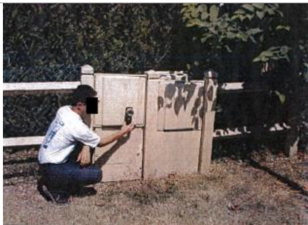
7 Chemin du Roy

Altitude calculée de l'eau (en m) : 60.35