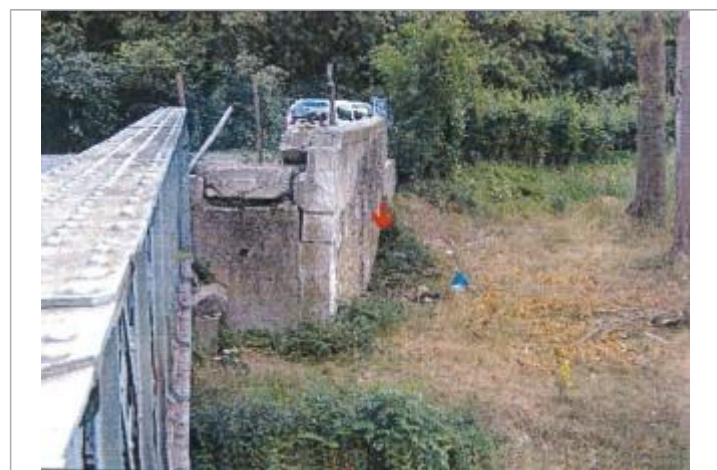
Pont des Cordeliers

GÉNÉRAL Code : EureMoy17_R_0010_a Date de mise à jour : 08/02/2019 Auteur :