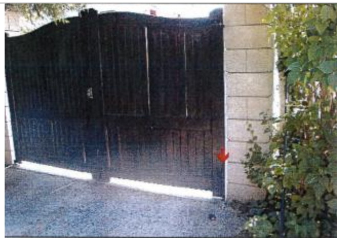
16 Impasse du Lavoir