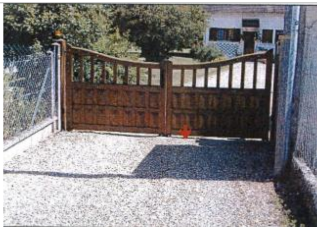
55 bis Rue André Tremblay