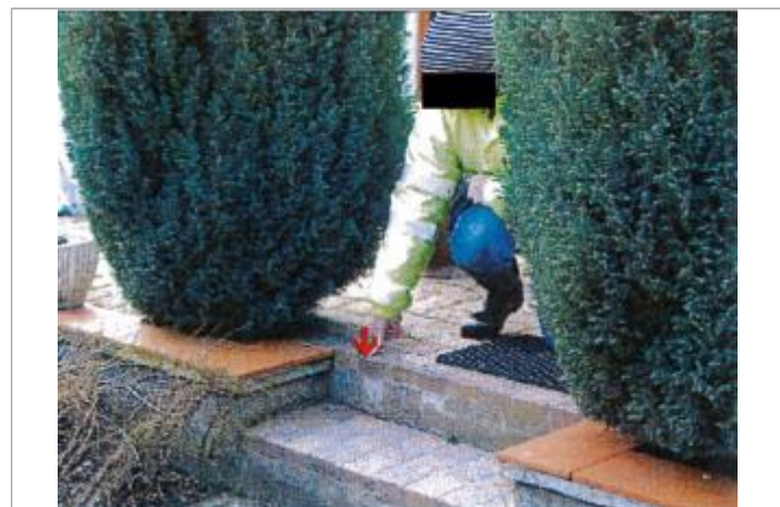
39 Rue de Bu

GÉNÉRAL Code : EureMoy17_R_0002_a Date de mise à jour : 08/02/2019 Auteur :