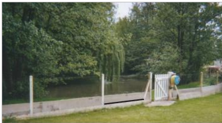
Rue des Grands Jardins