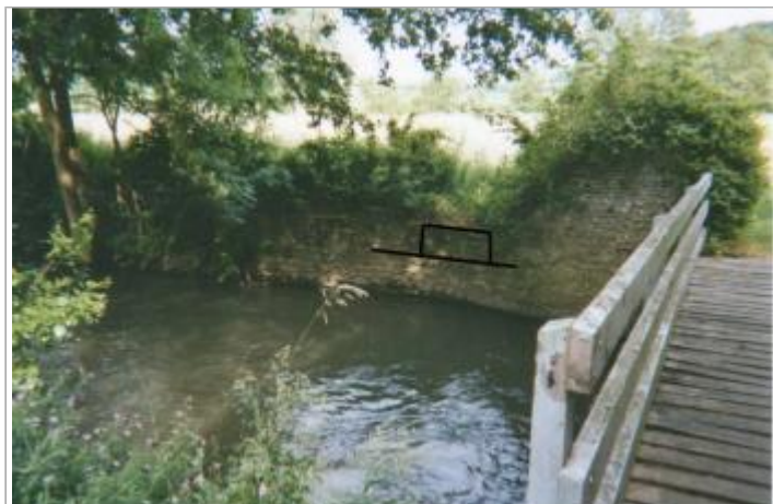
Moulin rouge (route de la porte des champs)

GÉOLOCALISATION Coordonnées WGS84 : X: 1.70013600 / Y: 49.23895700 Coordonnées RGF93 (Lambert 93) X: 605328.41 / Y: 6905143.38 Coordonnées RGF93 (ETRS89) : X: 1.700136 / Y: 49.238957 Code Hydro: H31-0400 Rive de référence: Droite