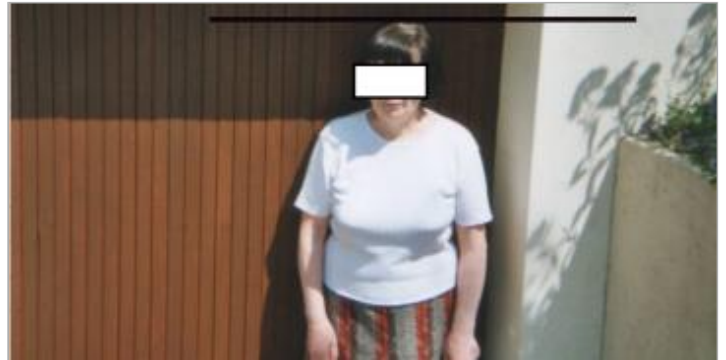
14, rue d'Eragny

Coordonnées WGS84 : X: 1.78110500 / Y: 49.28395700