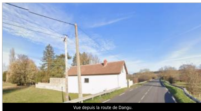
Vue depuis la route de Dangu.