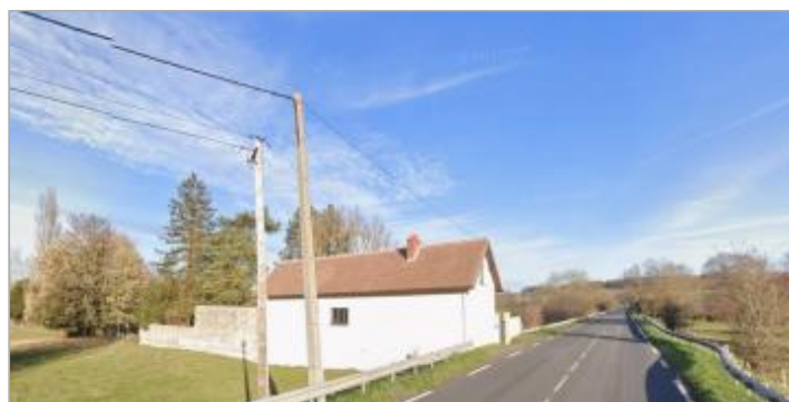
Vue depuis la route de Dangu.

GÉOLOCALISATION Coordonnées WGS84 : X: 1.70406300 / Y: 49.25258600 Coordonnées RGF93 (Lambert 93) X: 605639.27 / Y: 6906654.52 Coordonnées RGF93 (ETRS89) : X: 1.704063 / Y: 49.252586 Code Hydro: H31-0400 Rive de référence: Gauche