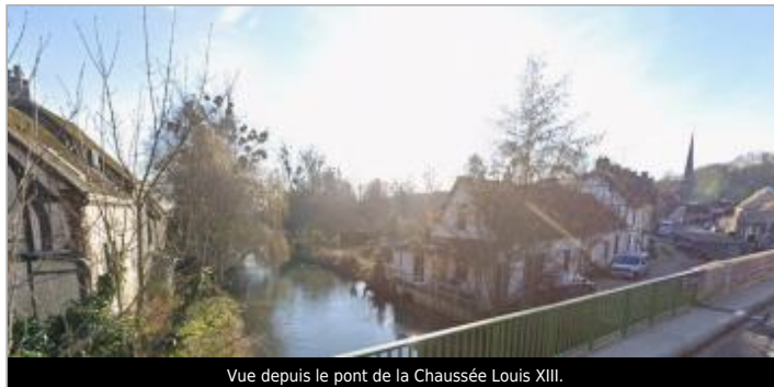
Vue depuis le pont de la Chaussée Louis XIII.