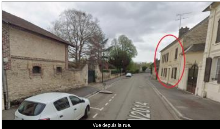
Vue depuis la rue.

Coordonnées WGS84 : X: 1.67671200 / Y: 49.20423100