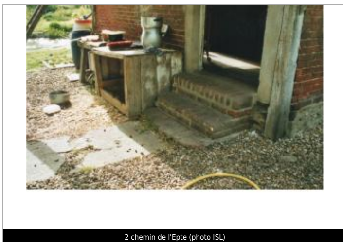
2 chemin de l'Epte

GÉOLOCALISATION Coordonnées WGS84 : X: 1.70963700 / Y: 49.26345600 Coordonnées RGF93 (Lambert 93) X: 606064.85 / Y: 6907856.87 Coordonnées RGF93 (ETRS89) : X: 1.709637 / Y: 49.263456 Code Hydro: H31-0400 Rive de référence: Gauche