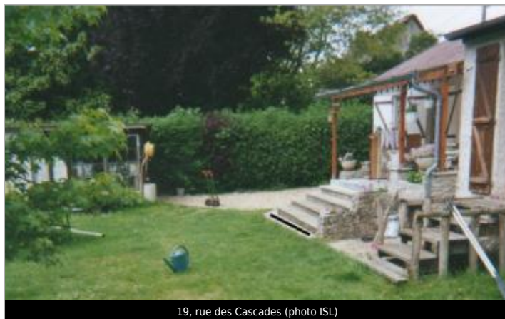
19, rue des Cascades

GÉOLOCALISATION Coordonnées WGS84 : X: 1.57741400 / Y: 49.07914600 Coordonnées RGF93 (Lambert 93) X: 596071.03 / Y: 6887525.06 Coordonnées RGF93 (ETRS89) : X: 1.577414 / Y: 49.079146 Code Hydro: H31-0400 Rive de référence: Droite