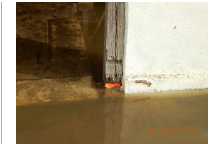
marque de peinture sur le lavoir

NIVELLEMENT SPC SACN. LE SPC N'EST PAS GÉOMÈTRE EXPERT, LES COTES SONT DONNÉES À TITRES INDICATIF. - 17/02/2021