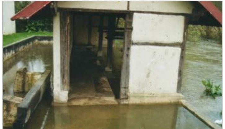
Le lavoir de Sainte-Genviève