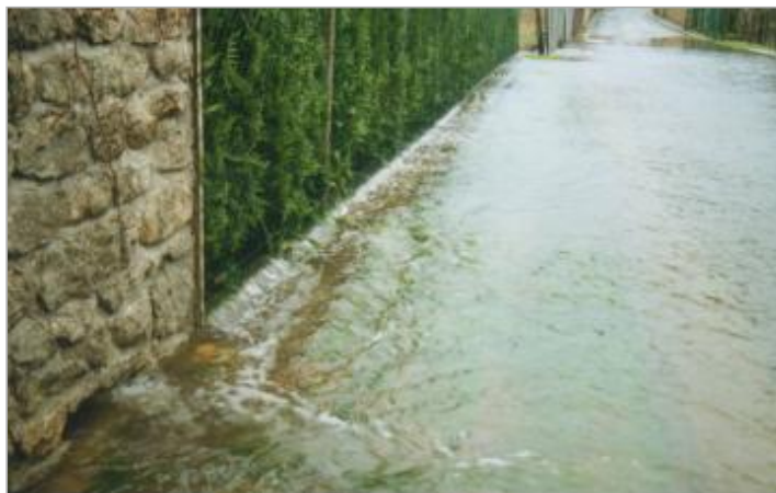
Rue de l'Eau