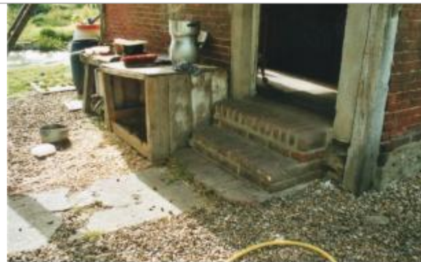
2 chemin de l'Epte