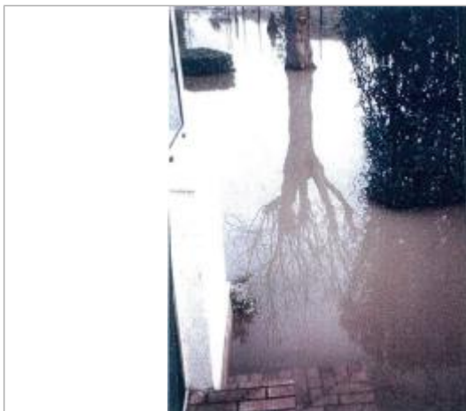
11 rue Verdier Monetti

Organisme : SPC Seine aval - Côtiers normands