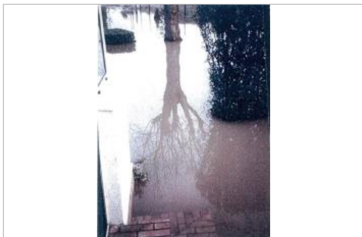
11 rue Verdier Monetti

Type de repérage : Source bibliographique Organisme(s) : SPC Seine aval - Côtiers normands