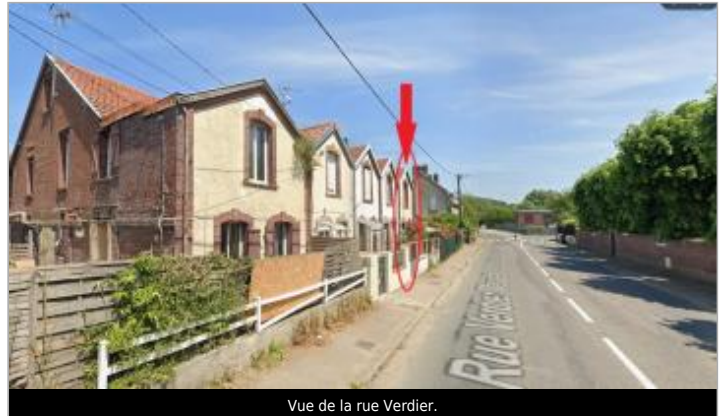
Vue de la rue Verdier.