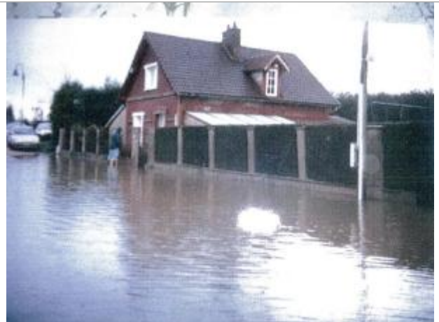
1 chemin des prairies