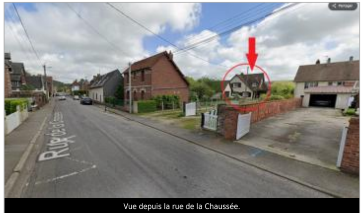
Vue depuis la rue de la Chaussée.

GÉOLOCALISATION Coordonnées WGS84 : X: 1.13220439 / Y: 49.88032750 Coordonnées RGF93 (Lambert 93) X: 565659.41 / Y: 6977321.46 Coordonnées RGF93 (ETRS89) : X: 1.1322044 / Y: 49.8803275 Code Hydro: G2100600 Rive de référence: Droite