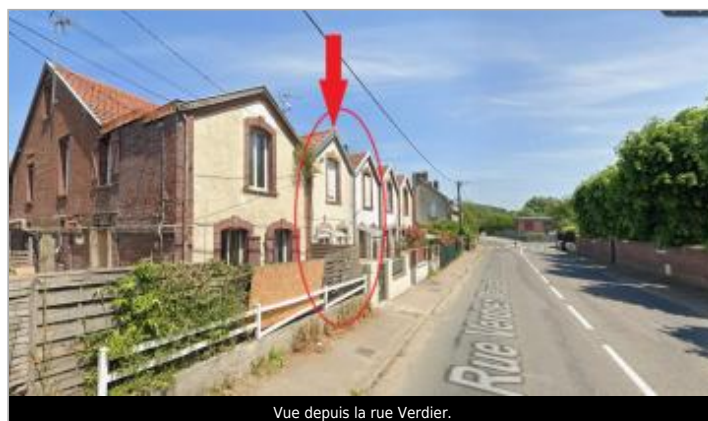
Vue depuis la rue Verdier.