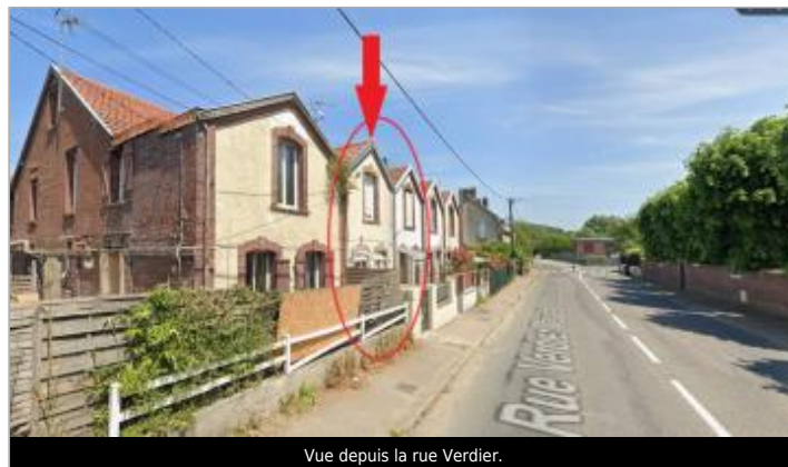
Vue depuis la rue Verdier.

GÉOLOCALISATION Coordonnées WGS84 : X: 1.13511280 / Y: 49.88121000 Coordonnées RGF93 (Lambert 93) : X: 565870.87 / Y: 6977414.73 Coordonnées RGF93 (ETRS89) : X: 1.1351128 / Y: 49.88121 Code Hydro: G2--0200 Rive de référence: Gauche