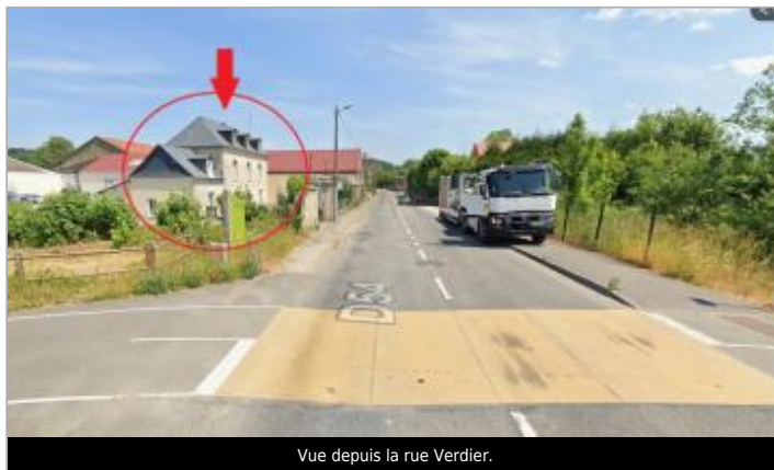
Vue depuis la rue Verdier.