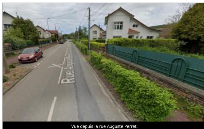
Vue depuis la rue Auguste Perret.