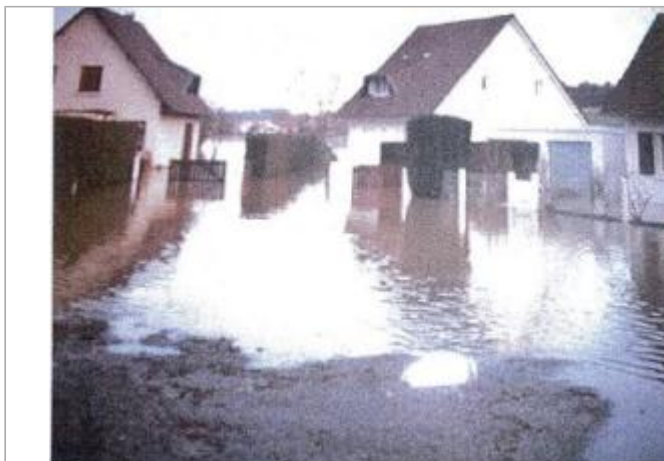
Résidence Henri IV