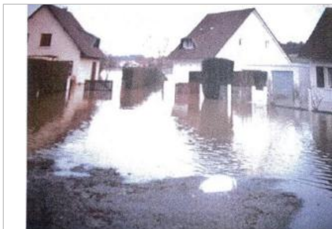
Résidence Henry IV

Organisme : SPC Seine aval - Côtiers normands