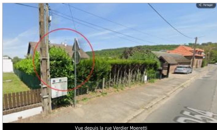
Vue depuis la rue Verdier Moeretti