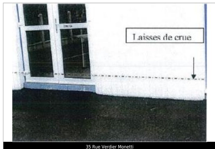
35 Rue Verdier Monetti