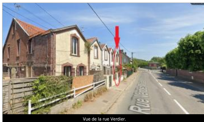
Vue de la rue Verdier.

GÉOLOCALISATION Coordonnées WGS84 : X: 1.13529880 / Y: 49.88113400 Coordonnées RGF93 (Lambert 93) X: 565884.05 / Y: 6977405.95 Coordonnées RGF93 (ETRS89) : X: 1.1352988 / Y: 49.881134 Code Hydro: G2--0200 Rive de référence: Gauche